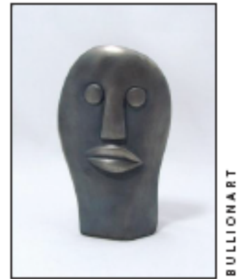
Esta escultura de plata .999, titulada Lips (Labios) , es un ejemplo de escultura Shona y representante de Bullion Art.

Para más información, visite http://www.bullion-art.com .