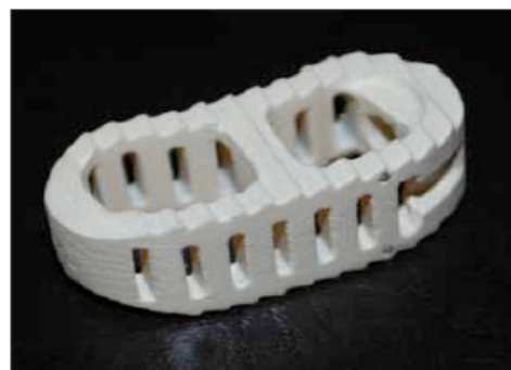
Este implante de “caja” espinal, incrustado de plata, ayuda a prevenir las infecciones durante la cirugía.