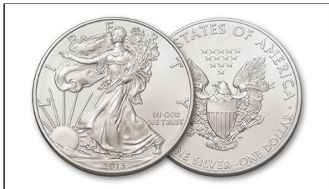
La American Silver Eagle es la moneda de lingotes de plata más popular del mundo.

La Casa de Moneda de Estados Unidos no es la única que presenta problemas de escasez. Después de que la Casa de Moneda hiciera el anuncio de la escasez, la Casa Real de Moneda de Canadá sufrió también una escasez de monedas de plata y limitó la venta a los distribuidores de su popular moneda Silver Maple Leaf.