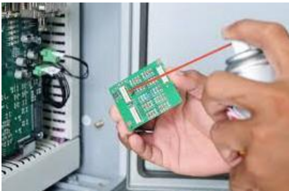
Los técnicos pueden usar aerosoles químicos para eliminar el deslustre de la plata en componentes electrónicos fundamentales.

El informe de investigación publicado en Angewandte Chemie , una revista de la Sociedad Química Alemana, está disponible aquí .