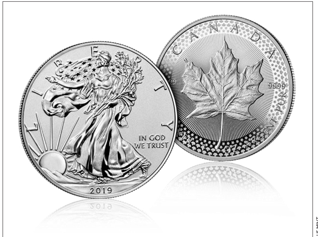
La colección de monedas Pride of Two Nations es una colaboración entre US Mint y Royal Canadian Mint.

La colección se vende por $139,95 dólares estadounidenses de US Mint y $189,95 dólares canadienses de RC Mint.