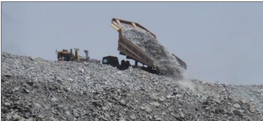
Un nuevo proceso puede convertir los desechos mineros en fertilizantes para el cultivo.