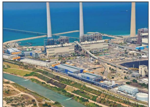
位于沙特阿拉伯 Ras Al Khair 的海水淡化厂，每天可产生一百多万立方米的淡水。

“在本研究中”，国立首尔大学化学与生物工程学院和化学过程研究所(ICP)的主要作者 Hwajoo Joo 写道，“利用锂离子电池电极材料[由氧化镁与银电极制成]，每天可以对 6 吨脱盐浓缩液进行锂采集（每小时 0.25 吨）……纯度达 88%，富集因子为 1,800”。虽然这种方法产生的锂的绝对数量很少，但联合国 2019 年估计，全球 16,000 座工厂每天可产生大约 50 亿立方米卤水，其中 5% 为盐和锂等其他化学物质。相较之下，海水中的盐和其他化学物质含量为 3.5%，具体数值取决于相应水体。